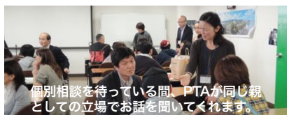
個別相談を待っている間、PTAが同じ親としての立場でお話を聞いてくれます。

北海道に高校留学。 家と程よい距離関係。 楽しい仲間と、大人のサポート、 素敵な出会いが、待っています。