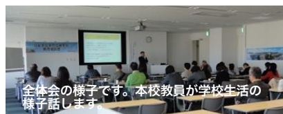
全体会の様子です。本校教員が学校生活の様子話します。

この相談会を子どもの未来を模索するためのひとつの機会にしてほしいと思っています。本校に入学するかどうか、この相談会に参加するかどうかを考えるより「何か見つかるものがあるかもしれない」という気持ちで参加していただけたら幸いです。様々な立場・経験者の話は少しでも皆さんのお役に立てるのではないかと考えています。