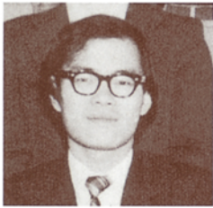
1974年(昭和49年)の高田先生